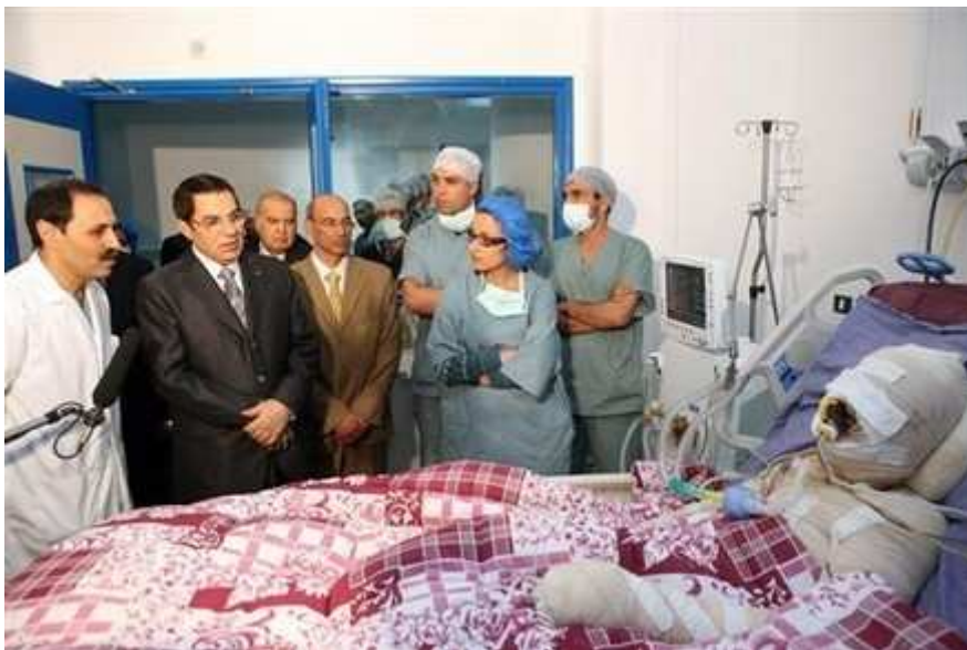
Mohamed Bouazizi tại bệnh viện. Phải chi bài học về sự vô cảm với dân này được các ‘đầy tớ’ VN thấm nhuần?

Ngay khi Mohamed đang được điều trị tại bệnh viện một cuộc biểu tình đã nổ ra. Cảnh sát lúc này vẫn chưa hết nóng nôi, bắn hơi cay để giải tán đám đông chẳng khác nào ‘đổ dầu thêm vào lửa’.