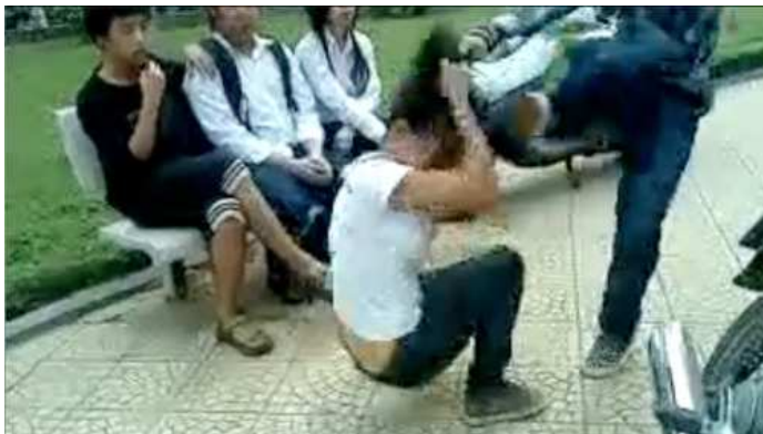
Căn bệnh vô cảm: Một số học sinh thân nhiên ngồi nhìn và quay phim một bạn gái bị đánh đập dã man trên phố

Nhìn vào thực tế chúng ta thấy trong nước trước nay không ít ‘ngòi nổ’ đã được châm, điển hình rất sớm ngay sau khi VN mở cửa đó là vụ nông dân nổi dậy ở Thái Bình hồi năm 1997. Chuyện người nghèo khổ rách áo ôm bán hàng rong bị cướp mất phương tiện như Mohamed là ‘chuyện thường ngày ở huyện’ tại các thành phố lớn với các chiến dịch làm đẹp lòng lề đường, làm đẹp hè phố. Hà Nội, Sài Gòn, Đà Nẵng, Đà Lạt v.v... cũng đã từng ra lệnh cấm bán hàng rong, cấm bán vé số gây bức xúc cho dư luận y hệt như Tunisia. Cũng có loại ‘ngòi nổ’ lớn và nguy hiểm do đụng chạm đến các tôn giáo, như vụ Tòa Khâm Sứ, Thái Hà, Tam Tòa, Đồng Chiêm hay Bát Nhã v.v... thế nhưng VN vẫn cứ ‘ổn định’ mà chẳng có cuộc cách mạng hoa nhài, bông bưởi nào xảy ra cả. Vì sao? Rõ ràng còn thiếu cái gì đó?