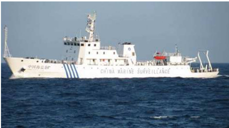
Tàu hải giám Trung Quốc mang số hiệu 84 vi phạm lãnh hải của Việt Nam.

Tuy nhiên, vào lúc 5h5 ngày 26/5, radar tàu địa chấn Bình Minh 02 đã phát hiện có tàu lạ đang chuyển động rất nhanh về phía khu vực khảo sát. Sau đó 5 phút thì phát hiện tiếp 2 tàu nữa đi từ phía ngoài vào. Đó là ba tàu hải giám của Trung Quốc chạy thẳng vào khu vực khảo sát mà không có cảnh báo.