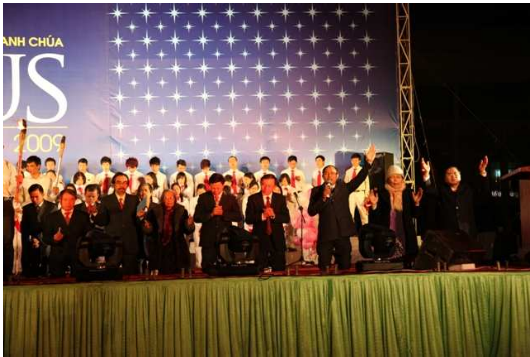
Các mục sư quỳ gối cầu nguyện cho sự hiệp một và phần hưng Việt Nam